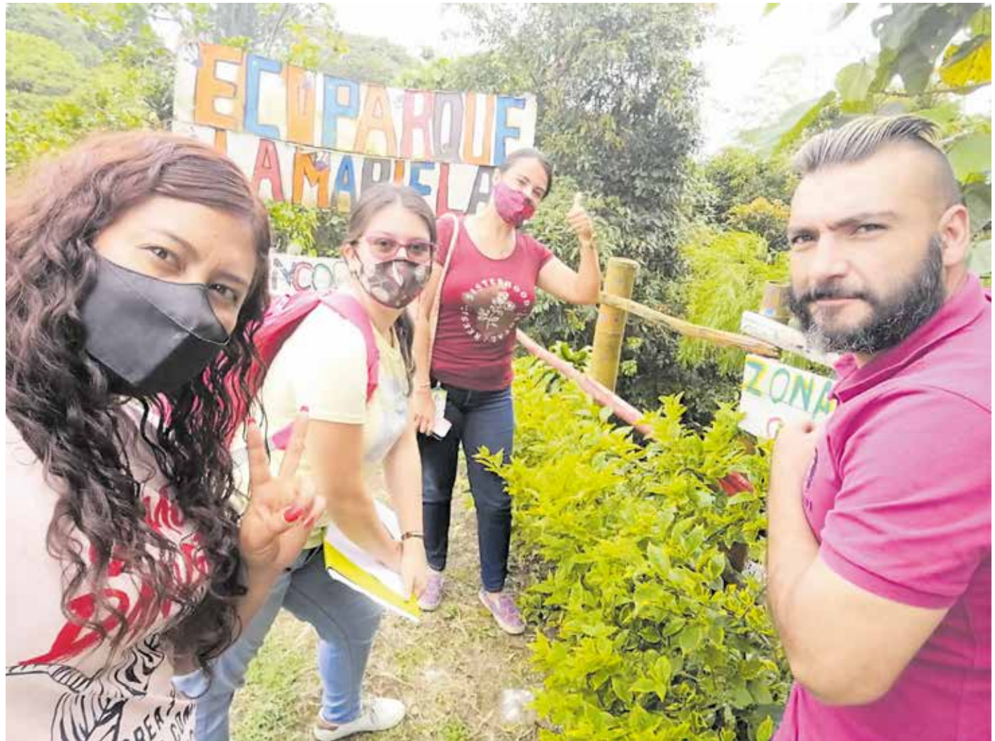
Los Incorrumpibles de La Mariela.

Nosotros tenemos varias líneas de trabajo, para impactar a niños,