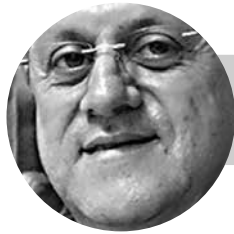
Carlos Arturo Quintero Gómez Obispo de Armenia

El 1 de enero de 1968, el papa San Pablo VI, instituyó el ‘día Mundial de la Paz’, “como presagio y como promesa, al principio del calendario que mide y describe el camino de la vida en el tiempo, de que sea la paz con su justo y benéfico equilibrio la que domine el desarrollo de la historia futura”. Desde entonces, todos los papas, han dirigido mensajes de fe y esperanza instando a la construcción de la paz. Para nosotros, quizás no es algo habitual pensar en esta jornada, porque la semana por la paz, se celebra en el mes de septiembre; sin embargo, esta jornada del 01 de enero, se erige como una fiesta en la que todos podemos recordar que la paz no se reduce a una simple celebración o a unos actos académicos y culturales; la paz es un camino o mejor, el camino es la paz. Precisamente, con motivo de la versión número 55 de esta jornada, el papa Francisco ha dirigido un mensaje a toda la humanidad, titulado: “diálogo entre generaciones, educación y trabajo: instrumentos para construir una paz duradera”.