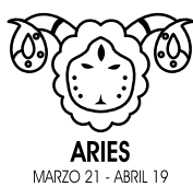
ARIES MARZO 21 - ABRIL 19

ARIES. Hoy tendrás un humor alegre y positivo, con los astros influyéndote positivamente, estarás listo para encarar proyectos nuevos y conocer gente. Hoy podrías presentarte de modo calmado y confiado. Tu autoestima estará elevada y te sentirás listo/a para enfrentar los desafíos que se presenten. ¡Hoy no dudes en correr detrás tus sueños! Ahora el éxito está al alcance de tu mano.