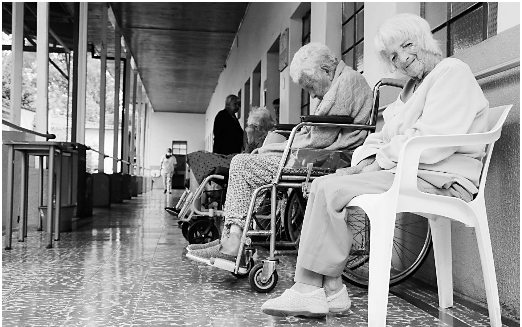
Centros de protección pretenden mejorar la calidad de vida de adultos mayores.