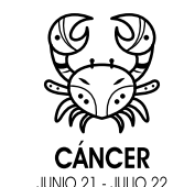
CÁNCER JUNIO 21 - JULIO 22

ACUARIO. En este momento podrías ingresar a algunos grupos sociales interesantes. La alineación astral podría estar realizando las conexiones sociales en tu vida. Podrían pedirte que participes de una fiesta con amigos. O un cliente amistoso podría invitarte a almorzar. Acepta estas invitaciones. Hoy te sentirás bien si te rodeas de personas interesantes. ¡No permitas que esa parte tímida de ti no te deje divertir!