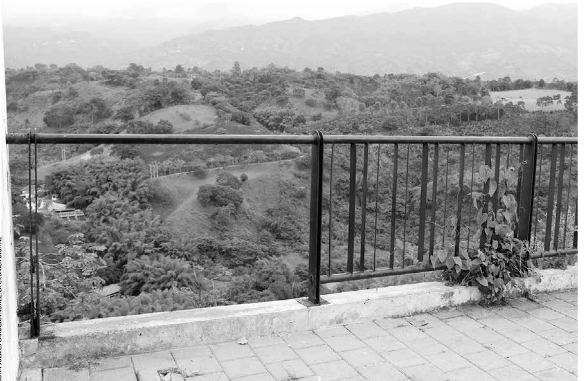
JOHN JOLMES CARDONA NUÑEZ, LA CRÓNICA DIGITAL

Un padre de familia, quien no quiso dar su nombre, también criticó el olvido en el que se encuentra el lugar: “Esto parece que se ha vuelto el sitio de reunión de consumidores y de delincuentes, ya uno lo piensa 2 veces para venir a caminar un