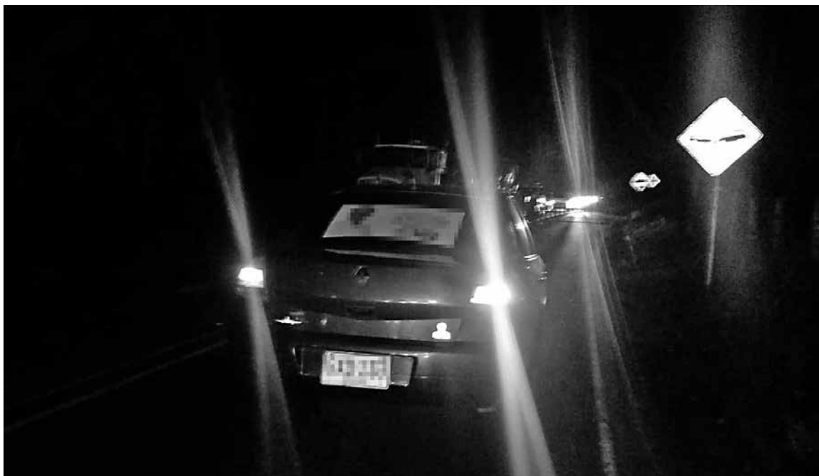
Los hechos se presentaron en el sector Tres Esquinas, vereda Laurel del municipio de Quimbaya.

Los hechos se presentaron en la noche del pasado viernes 14 de enero en la subestación ubicada en la vereda Laurel, jurisdicción del municipio de Quimbaya, de acuerdo con información dada a conocer por autoridades de la