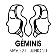
GÉMINIS MAYO 21 - JUNIO 20

CAPRICORNIO. Con un cambio en la alineación planetaria, hoy podrías sentir la necesidad repentina de resolver cosas del pasado. Si necesitas hacer las paces con alguien, hoy es un buen día para ello. O si necesitas resolver un tema financiero, este es el momento de ocuparte. Desearás comenzar desde cero y avanzar con energía nueva. No permitas que nada del pasado te retenga.