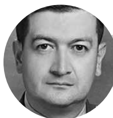
Cr. Jimmy J. Bedoya @CrJBedoya

La nueva Ley de Seguridad Ciudadana aprobada a finales del año 2021 es uno de los pilares de la política en asuntos relacionados con la protección al ciudadano que ha formulado el Gobierno Nacional. Esta norma busca acondicionar varios códigos y leyes para fortalecer la seguridad ciudadana y ampliar los instrumentos jurídicos con los que deben contar las autoridades para contrarrestar la delincuencia en las ciudades.