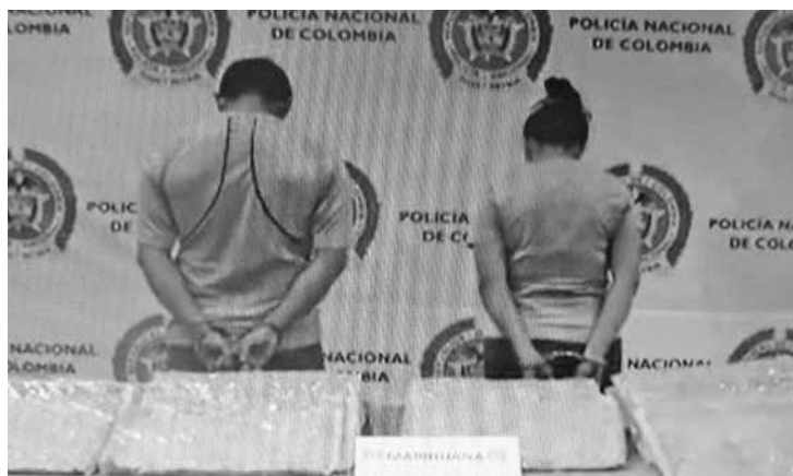
La aprehensión de las personas con el cargamento se dio en el barrio Veracruz, al sur de la ciudad.

"Fueron detenidos en flagrancia. Este es el resultado de un trabajo articulado de la Seccional de Investigación Criminal con la Fiscalía General de la Nación, y mediante diligencias de hallanamiento