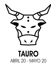
TAURO ABRIL 20 - MAYO 20

SAGITARIO. El aire de hoy te brinda buenas cosas y te trae buenas noticias. Podrías obtener una oferta de un empleador potencial a quien contactaste meses atrás. Quizás tu curriculum se perdió en sus archivos, pero ahora se ocuparán de ti. O quizás recibas noticias gratificantes de tu actual jefe. Podrías descubrir que reúnes las condiciones para recibir un aumento de sueldo o una promoción. ¡Te lo mereces!